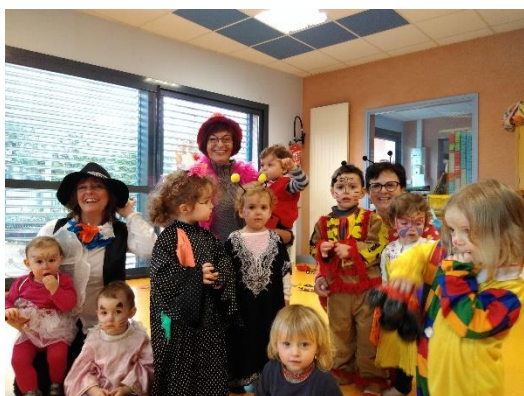
Carnaval à St Amans