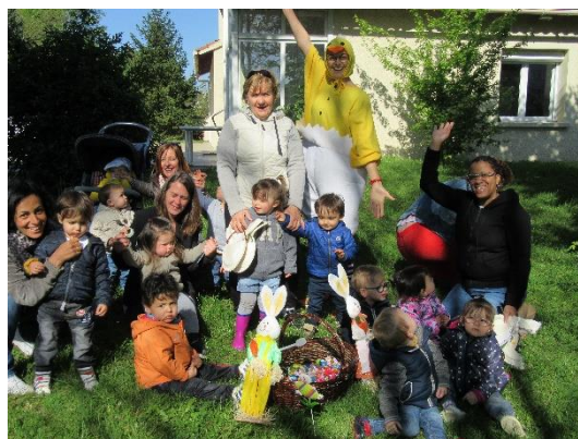
Chasse aux œufs à Aussillon