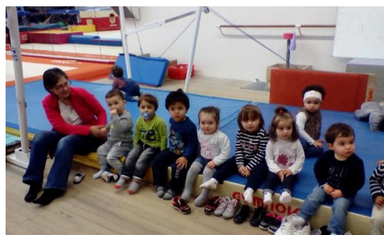
La séance d'Hautpouloise va bientôt commencer...