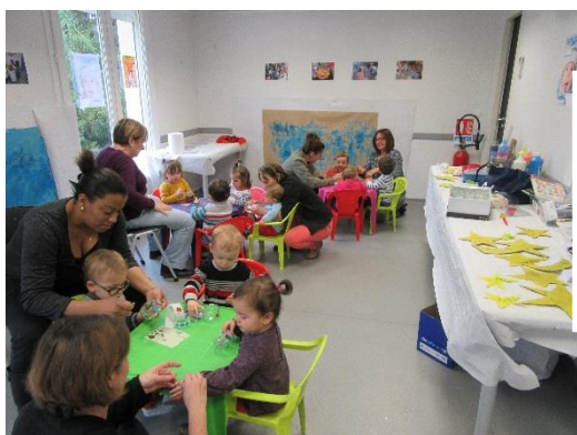
Grande Semaine De la Petite Enfance